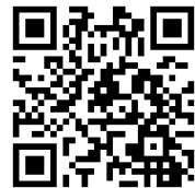
参考動画 QR コード